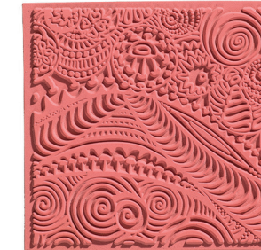
95 005 01 / Freestyle