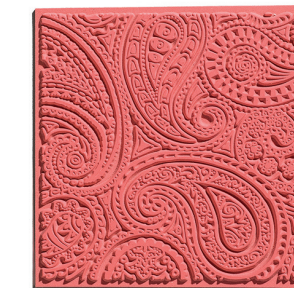
95 005 10 / Paisley