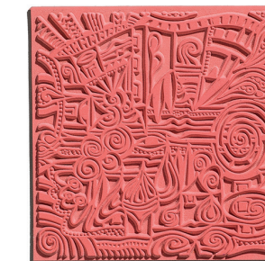
95 005 07 / Village