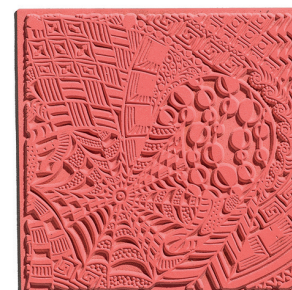
95 005 09 / Dreams