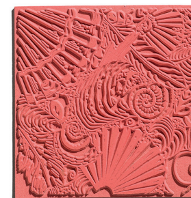
95 005 08 / Shells