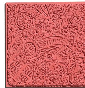
95 005 05 / Flowers