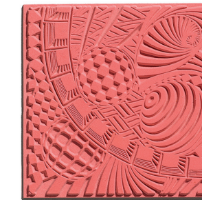
95 005 04 / Space