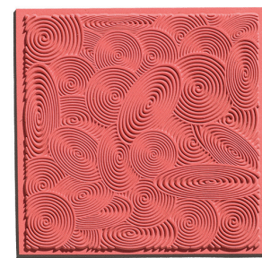
95 005 12 / Spirals