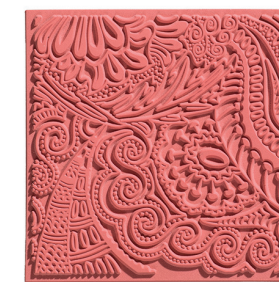
95 005 02 / Moments