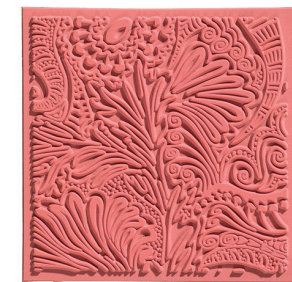
95 005 03 / Phantasy